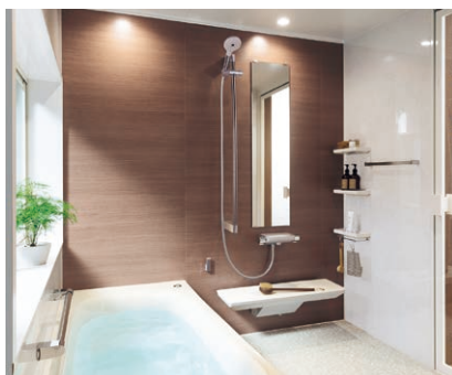
TOTO システムバスルーム「サザナ」