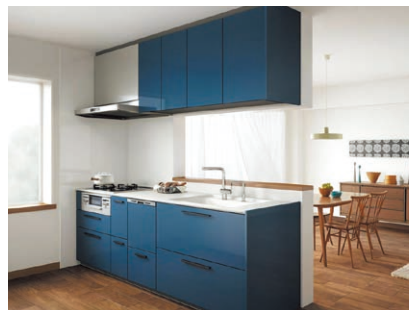
TOTO システムキッチン「ザ・クラッソ」

※1:「キッチンセットの交換を伴う対面化改修」で補助金が交付される場合「掃除しやすいレンジフード」、「ビルトイン自動調理対応コンロ」の補助は受けられません。