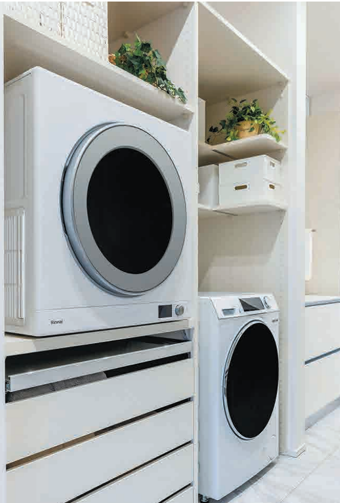
設置場所や目的に応じて最適な機能を持った収納棚をラインナップ