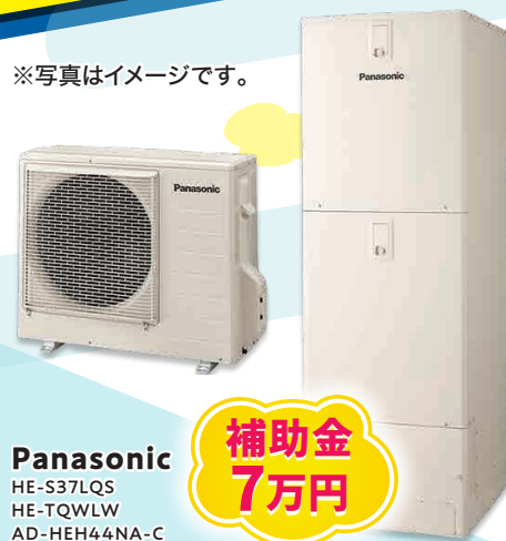
※写真はイメージです。 Panasonic HE-S37LQS HE-TQWLW AD-HEH44NA-C