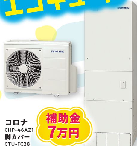
コロナ CHP-46AZ1 脚カバー CTU-FC28