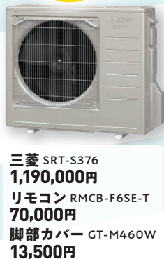
三菱 SRT-S376 1,190,000円 リモコン RMCB-F6SE-T 70,000円 脚部カバー GT-M460W 13,500円